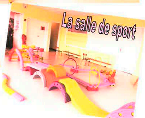
La salle de sport