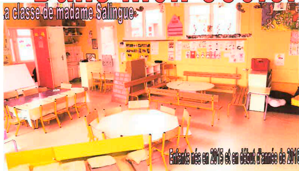
Enfants nés en 2015 et en début d'année de 2016