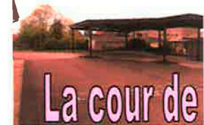
La cour de récréation